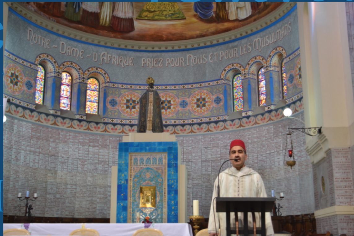
Un imam dans Notre-Dame d'Afrique, Alger, Notre-Dame Afrique