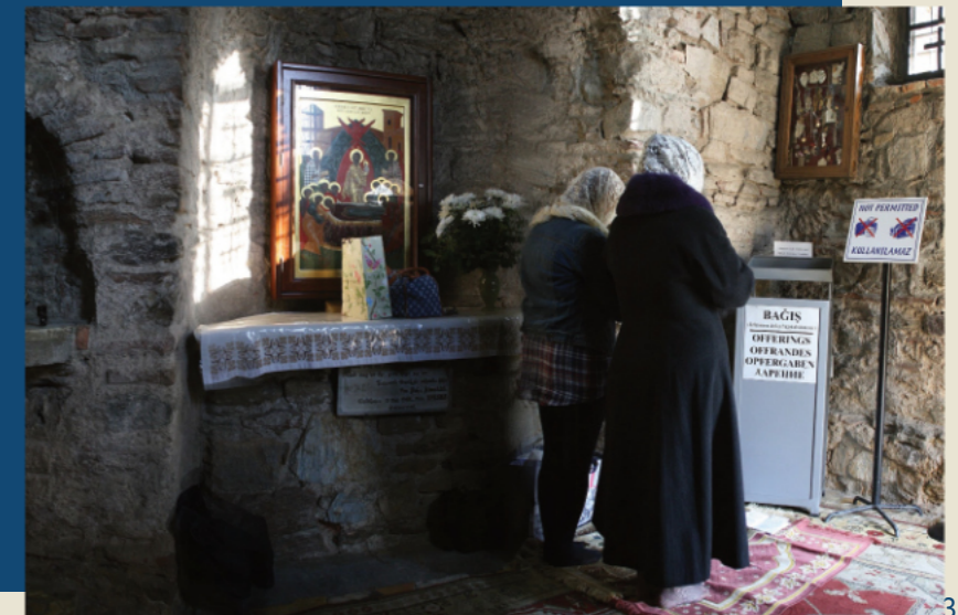
Femmes soufies priant dans le sanctuaire catholique de la Maison de Marie, Éphèse, Turquie, Manoël Pénicaud

Après la proclamation du dogme de l'Assomption en 1950, ce modeste sanctuaire a connu un essor fulgurant, attirant rapidement des foules de chrétiens et de musulmans. Aujourd'hui, touristes et pèlerins se côtoient dans une ambiance paisible, favorisée par les franciscains qui administrent le site.