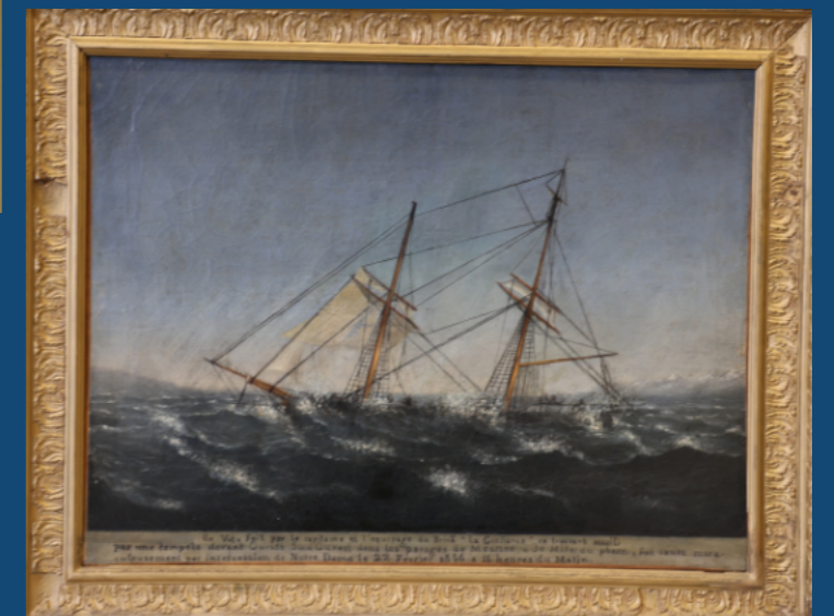
Voilier dans la tempête (ex-voto) Musée Notre-Dame de la Garde

A Oran, depuis longtemps l'église Notre-Dame de Santa-Cruz jette son regard bienveillant sur la ville que Marie aurait libérée en 1849 du choléra.