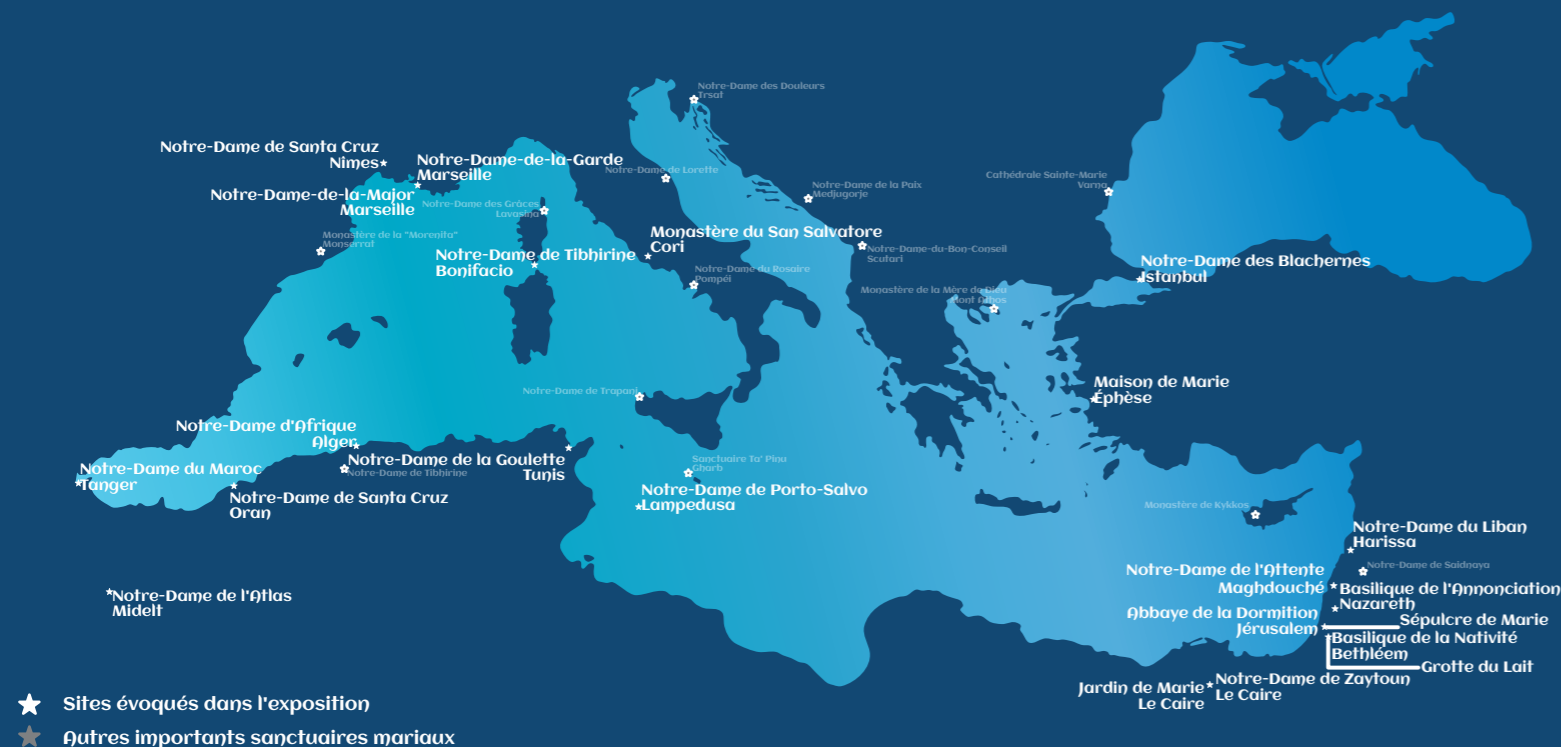
Carte des sanctuaires évoqués dans l'exposition Ave Maria, conception graphique P. Stéphan Sciortino-Bayart