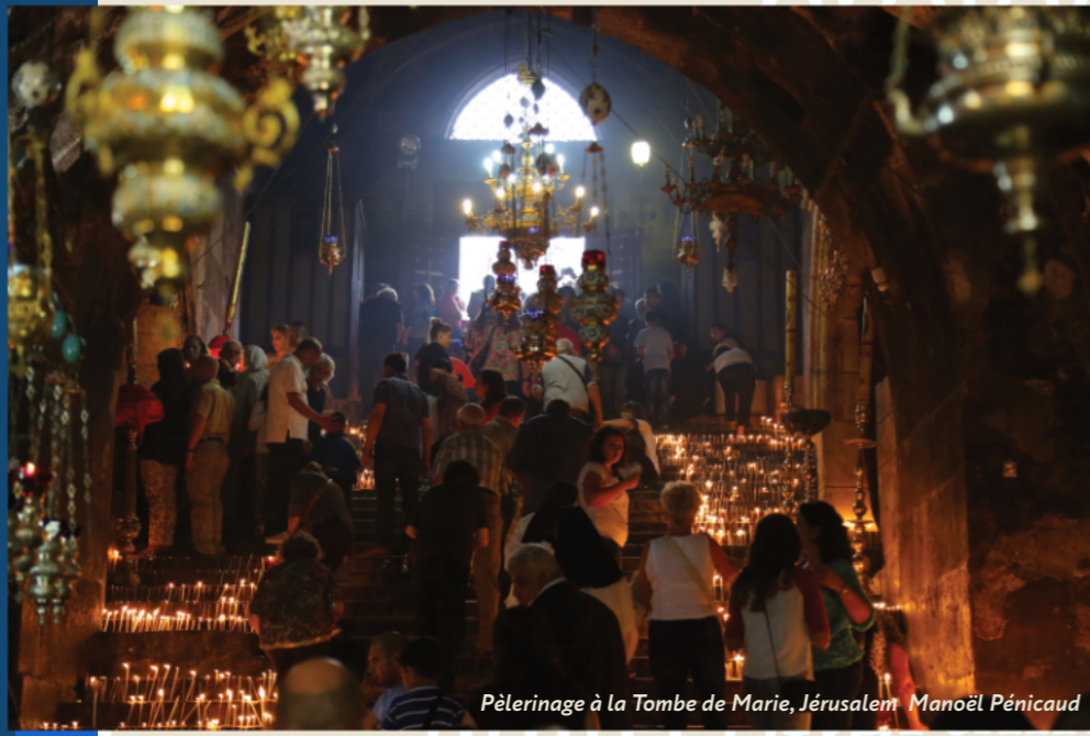
Pèlerinage à la Tombe de Marie, Jérusalem, Manoël Pénicaud