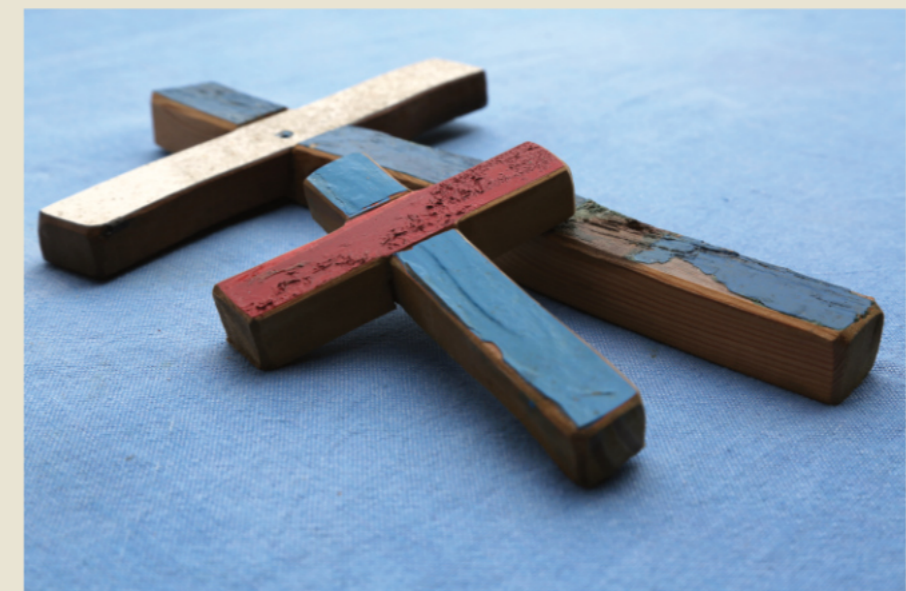
Croix confectionnées avec le bois de barques de migrants, Francesco Tuccio