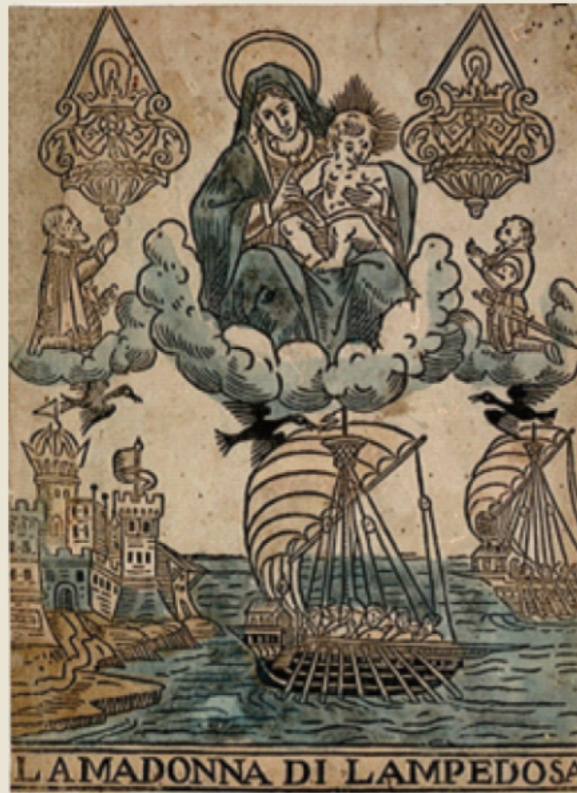
Ex-voto de la Madonna di Lampedusa, Collection particulière

"Immigrés morts en mer, dans ces bateaux qui au lieu d'être un chemin d'espérance ont été un chemin de mort. (...) Dans ce monde de la mondialisation, nous sommes tombés dans la mondialisation de l'indifférence."