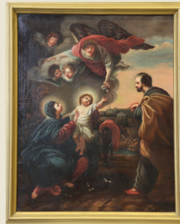
Le repos durant la fuite en Égypte, Musée de Notre-Dame-de-la-Garde

Le cycle marial est ponctué d'épisodes bien connus, et débute par la naissance de la Vierge, suivie de sa Présentation au Temple par ses parents Anne et Joachim. Jeune juive très pieuse, elle a choisi de vouer sa vie à Dieu. Lors de l'Annonciation à Nazareth, après que l'ange Gabriel la salue (« Ave Maria »), elle accepte d'accueillir Jésus en son sein, devenant un modèle d'hospitalité divine.