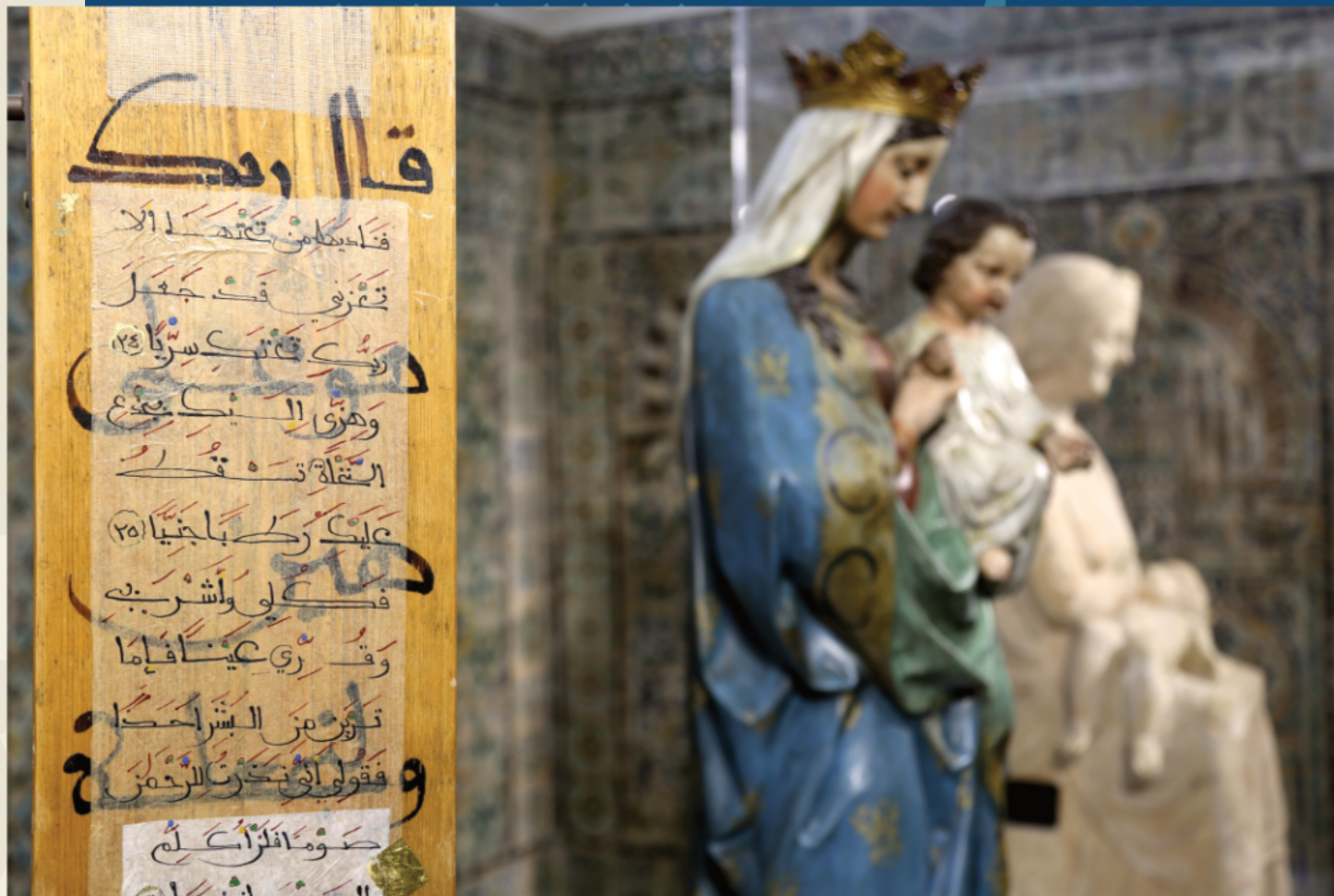
La Vierge Marie dans l'exposition 'Lieux saints partagés au Musée du Bardo, Manoël Pénicaud