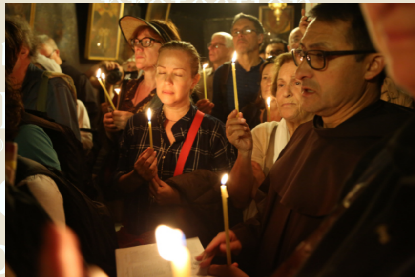
Pèlerins dans la crypte de la Basilique de la Nativité, Bethléem, Manoël Pénicaud