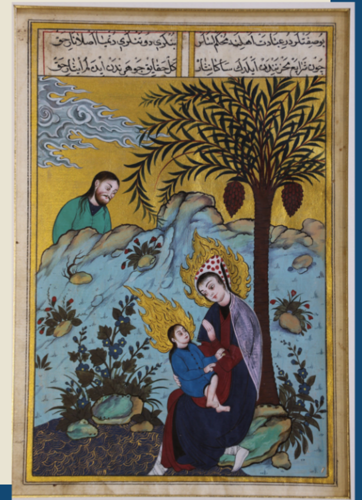
Miniature musulmane de la Nativité de Jésus, Ayse Özalp

La Nativité à Bethléem est une séquence centrale, suivie de la Fuite en Égypte. L'Assomption, enfin, aurait eu lieu aux portes de Jérusalem. De nos jours, de nombreux sites mariaux évoquant ces épisodes sont visités par des fidèles de religions et de confessions différentes.