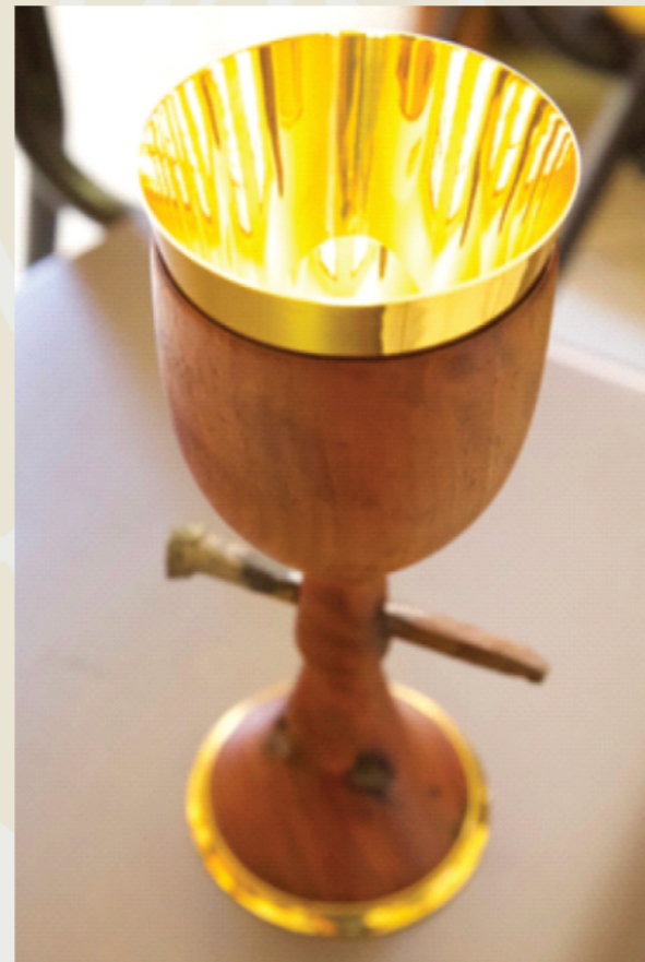
Calice du Pape François en bois des barques de migrants, Lampedusa, Francesco Tuccio

Pape François, le 8 juillet 2013 à Lampedusa