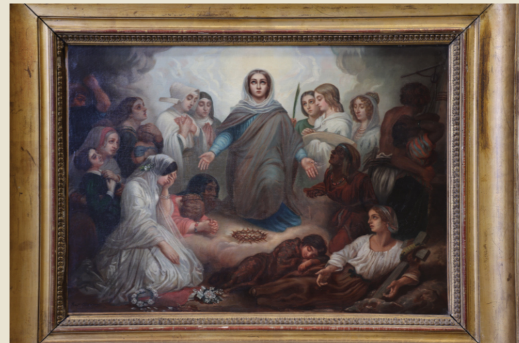
Notre-Dame des affligés, Musée Notre-Dame-de-la-Garde

Un site Internet (ENG) sur le thème des « lieux saints partagés » : https://www.sharedsacredsites.net/