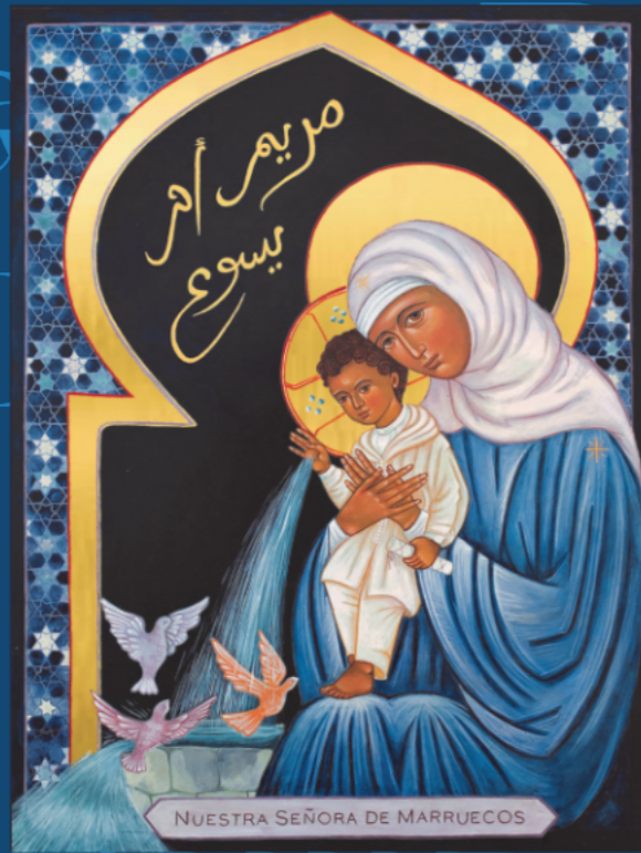
Ícone de Notre-Dame du Maroc Sœurs carmélites de Tanger