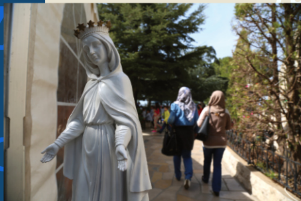
Musulmanes à Notre-Dame de Harissa, Liban, Manoël Pénicaud