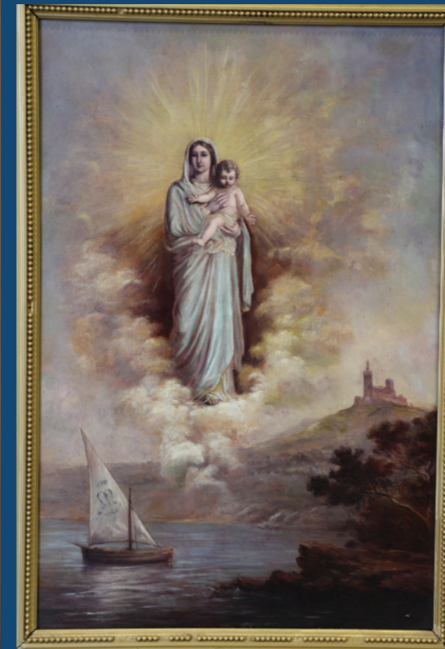
La Bonne Mère, patronne des marins, Musée de Notre-Dame de la Garde

A Marseille, chaque jour des milliers de regards convergent vers Notre-Dame de la Garde, que l'on voit de toute la baie. Elle veille sur l'ensemble des habitants, notamment sur les marins qui lui vouent un culte fervent et reconnaissent sa main secourable contre les dangers de la mer. En témoignent les milliers d'exvotos (remerciements après un vœu) dont la Basilique est ornée.