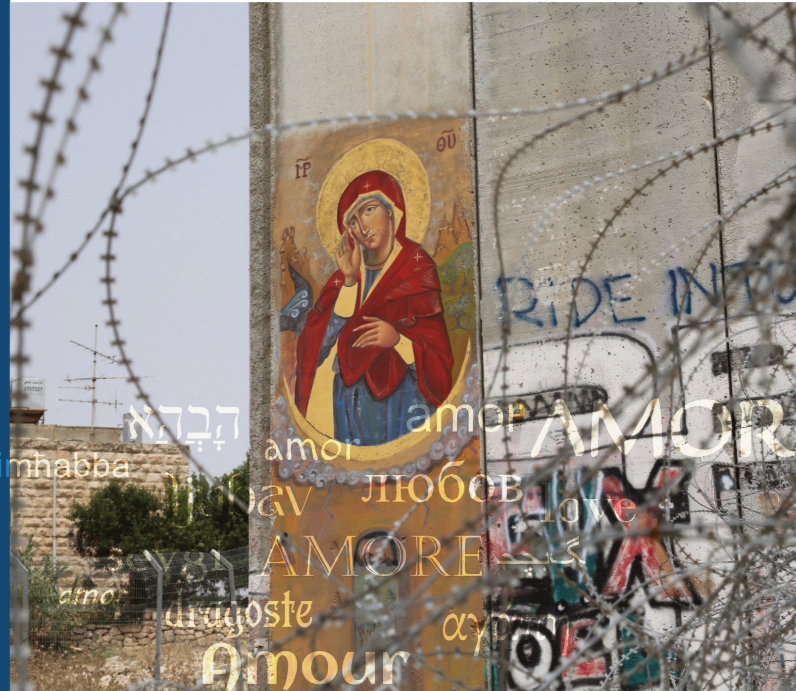
Notre Dame qui fait tomber les murs, Bethléem, Manoël Pénicaud

Paola de Campou paola@les-toquees-de-lacom.com +33 6 28 90 60 67